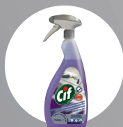
CIF DETERGENT DEZINFECTANT LICHID 2ÎN1