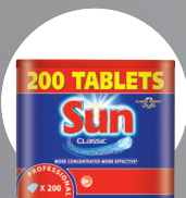
SUN TABLETE PENTRU MAȘINILE DE SPĂLAT VASE