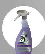
CIF PROFESSIONAL 2IN1 DESINFIZIERENDEINIGER